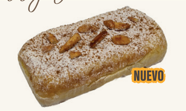
TORRIJA CREMA MERENGADA