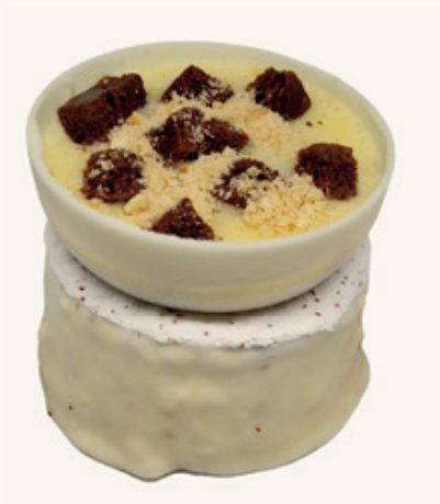
TARTA GALLETA & CARAMELO