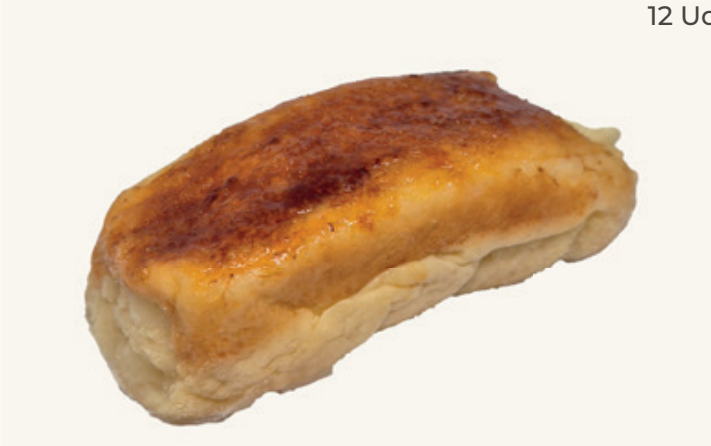
TORRIJA CREMA CLÁSICA