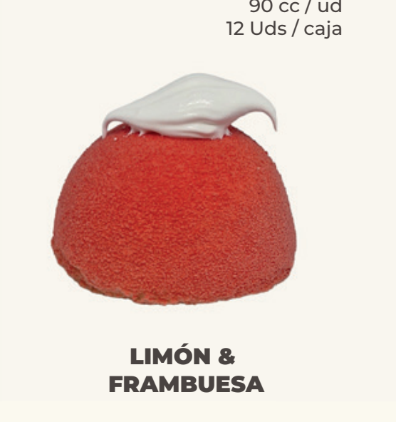
LIMÓN & FRAMBUESA