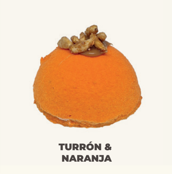
TURRÓN & NARANJA