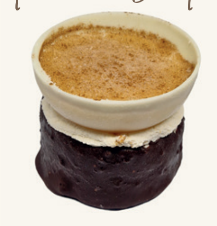
TURRÓN & ARROZ CON LECHE