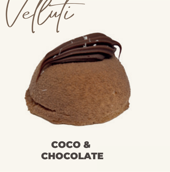
COCO & CHOCOLATE